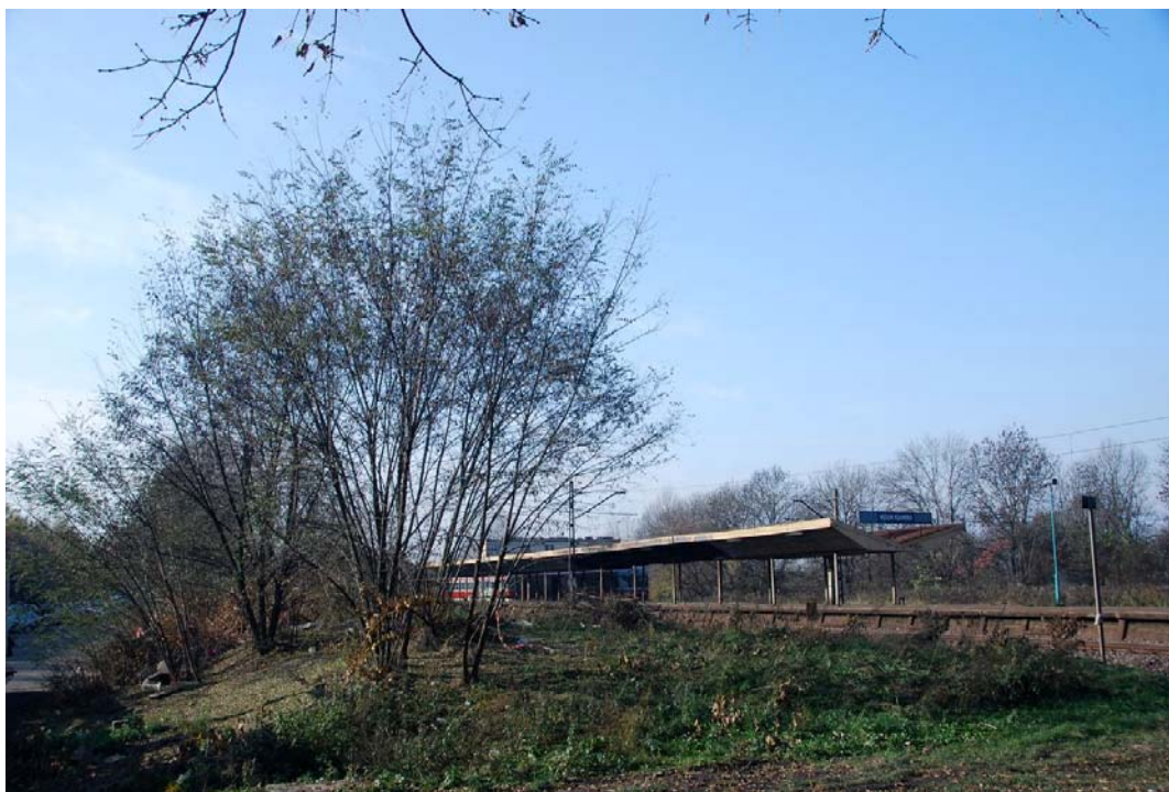
Rycina 12. Widok stacji z osiedla Ksawera