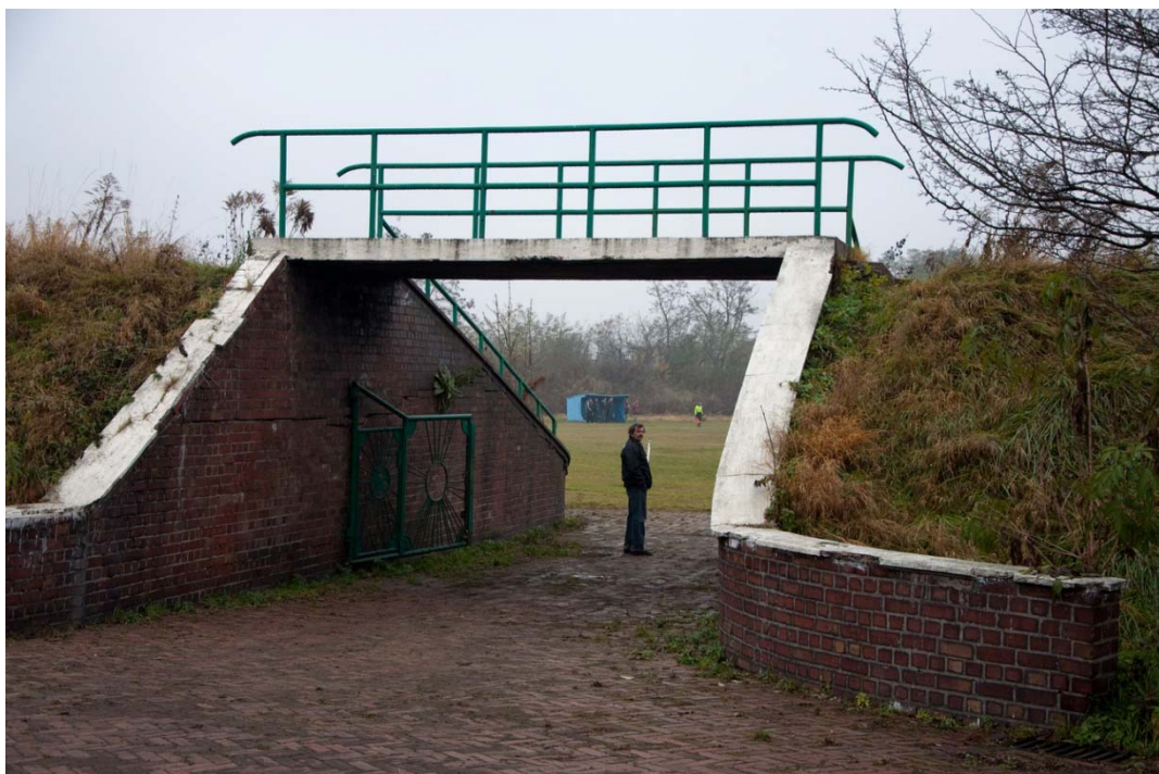
Rycina 11. Pozostałości po kompleksie sportowym Zagłębianka; stadion