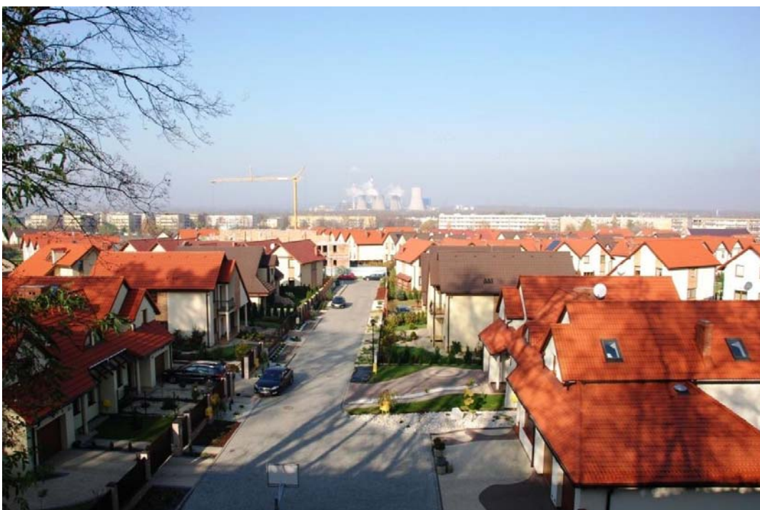
Rycina 4. Osiedle domków jednorodzinnych Podskarpie