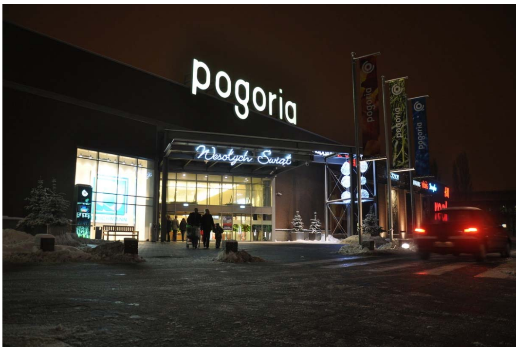
Rycina 20. Najbliższy hipermarket Pogoria w Dąbrowie Górniczej