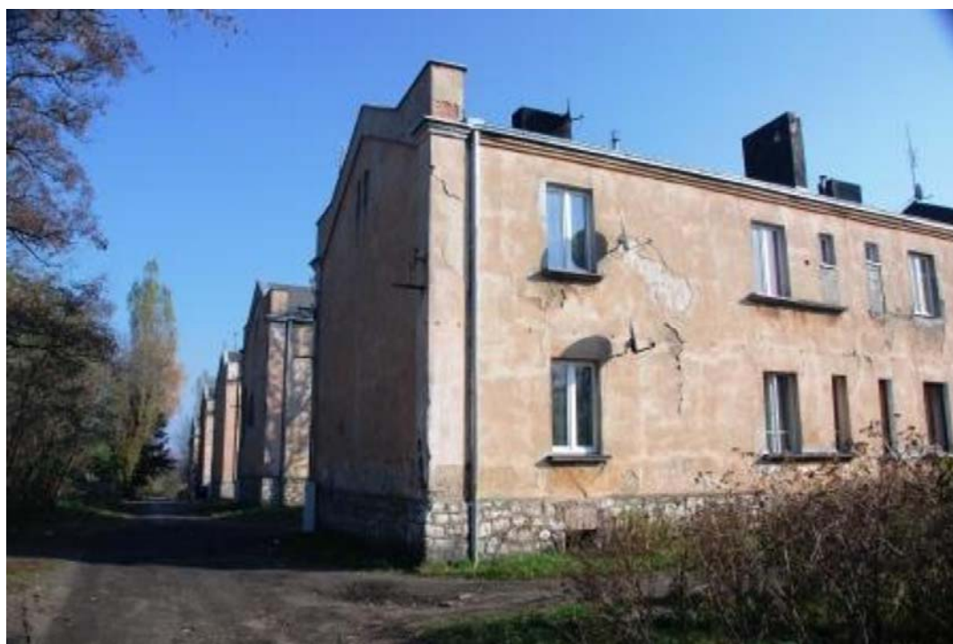
Rycina 6. Koszelew. Obraz za plecami fotografującej – nowoczesne osiedle Podskarpie