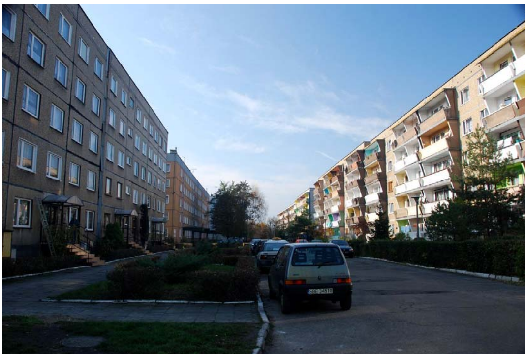
Rycina 2. Ksawera. Ulica Żwirki i Wigury