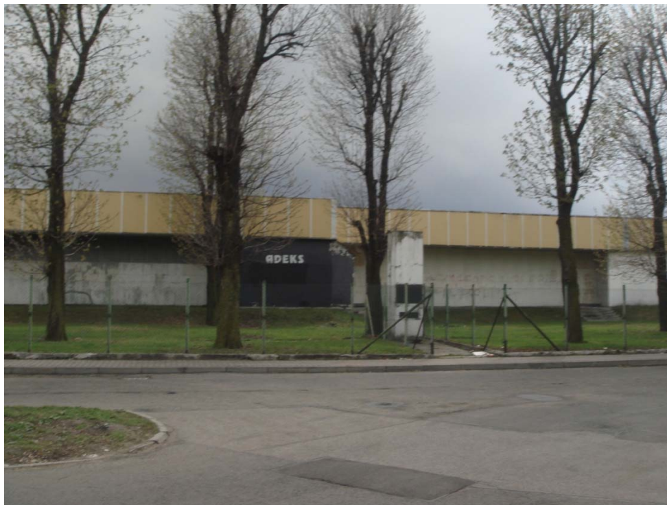
Rycina 18. Pomnik na osiedlu Ksawera. Obecne otoczenie