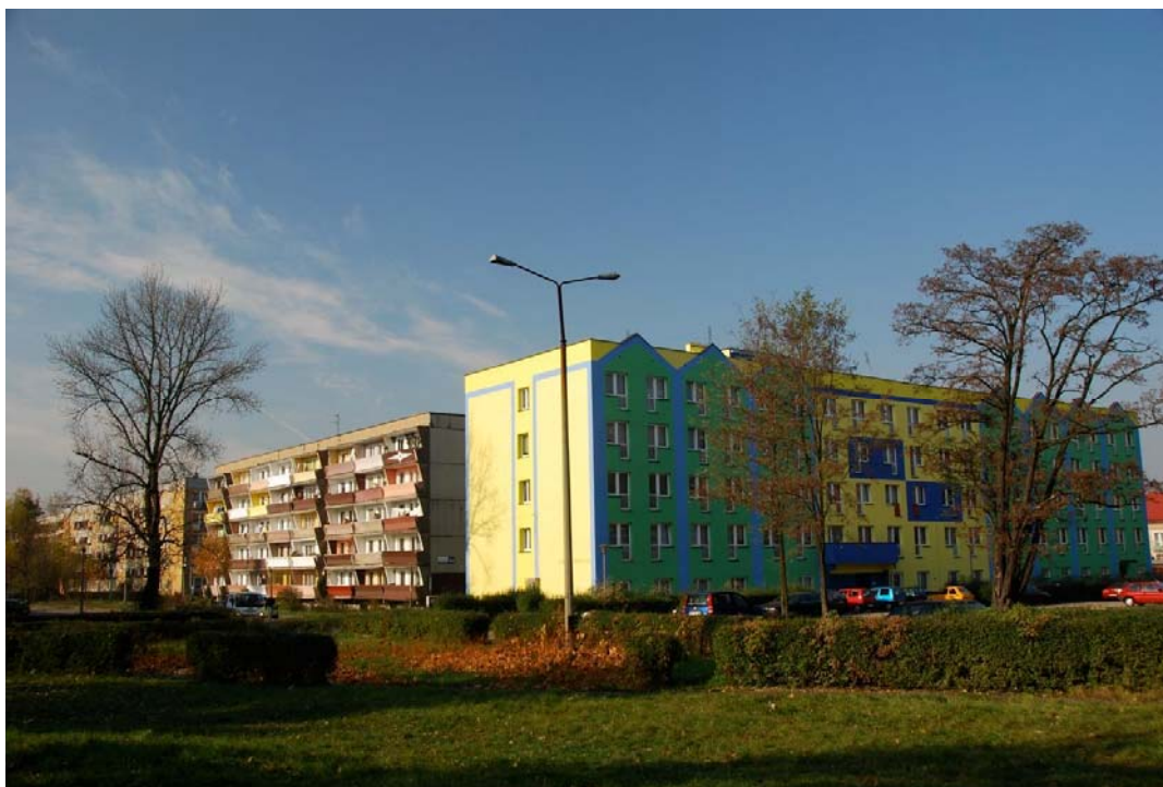
Rycina 1. Widok osiedla Ksawera od ulicy Siemońskiej