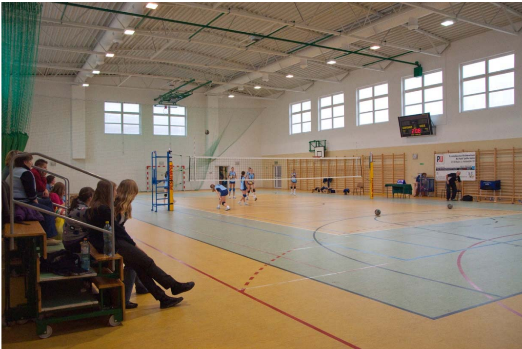
Rycina 18. Nowa hala sportowa w Będzinie-Ksawerze

(Była pracownica kopalni "Paryż", po zamknięciu kopalni wielokrotnie zmieniała miejsce pracy).