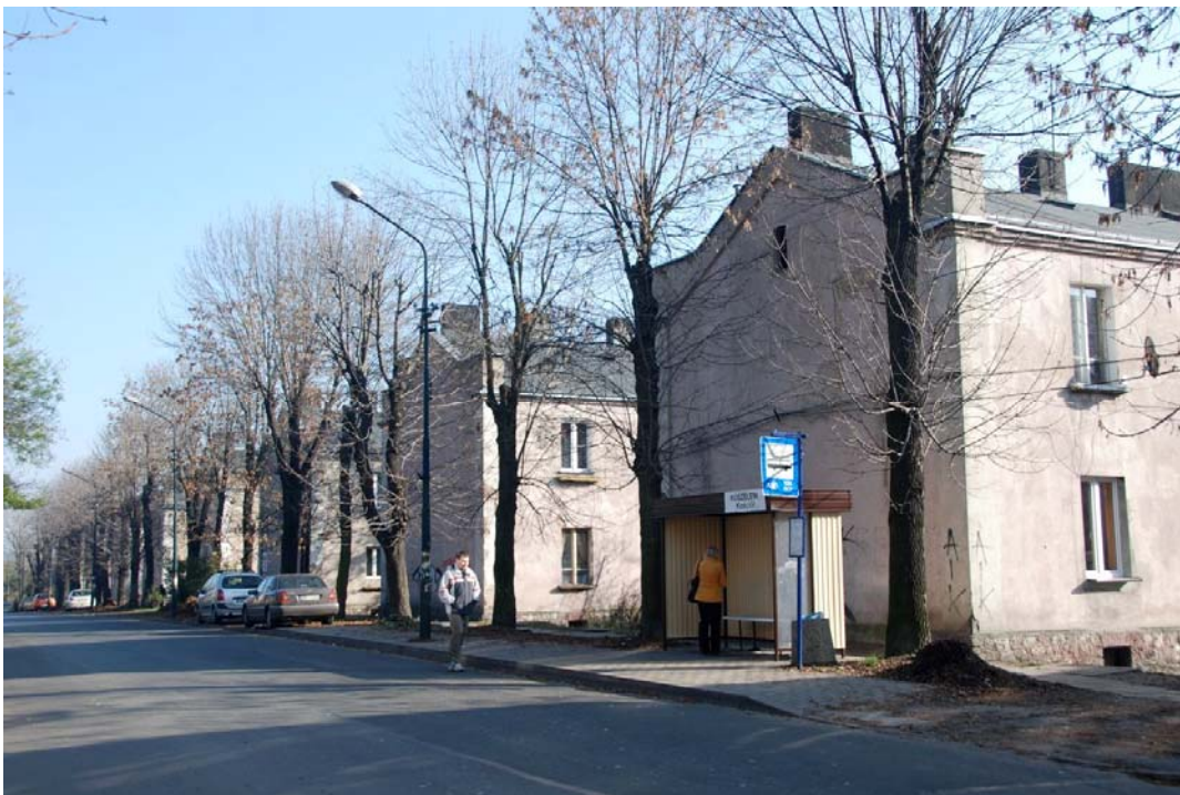
Rycina 3. Koszalew, kiedyś osobna dzielnica, teraz część Ksawery