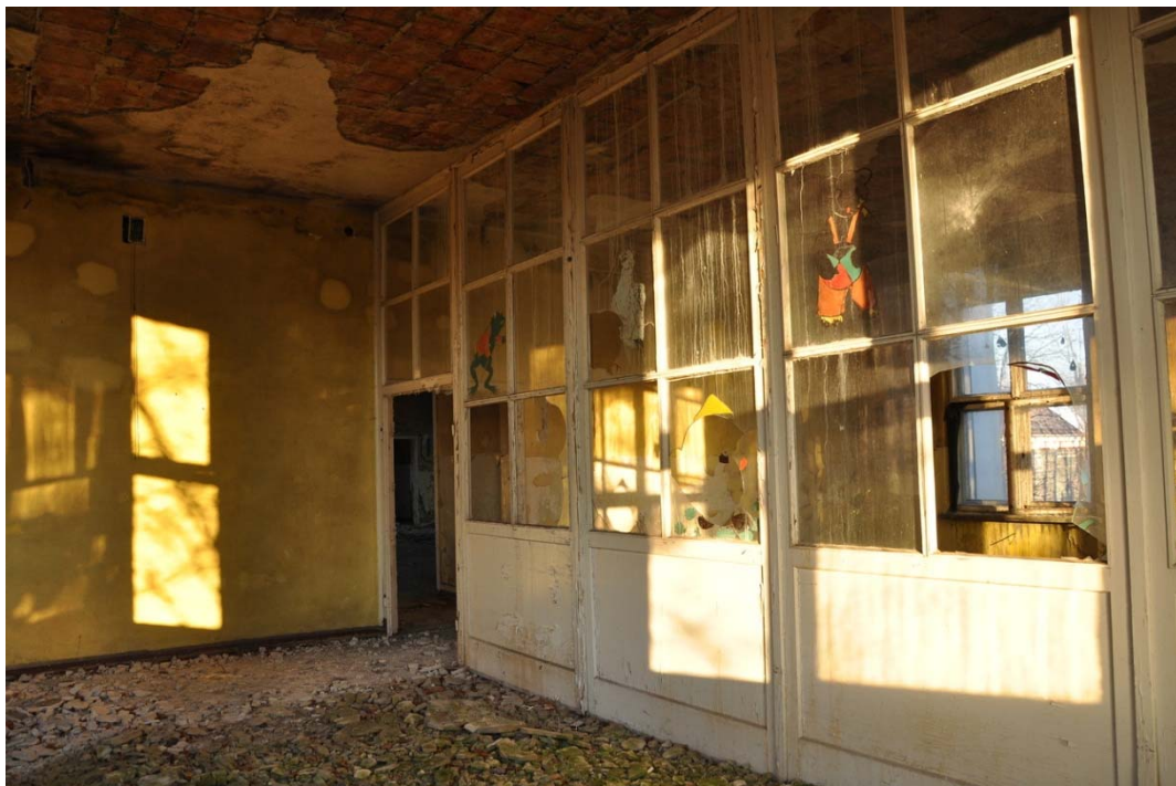
Rycina 8. Pozostałości po żłobku na osiedlu Ksawera