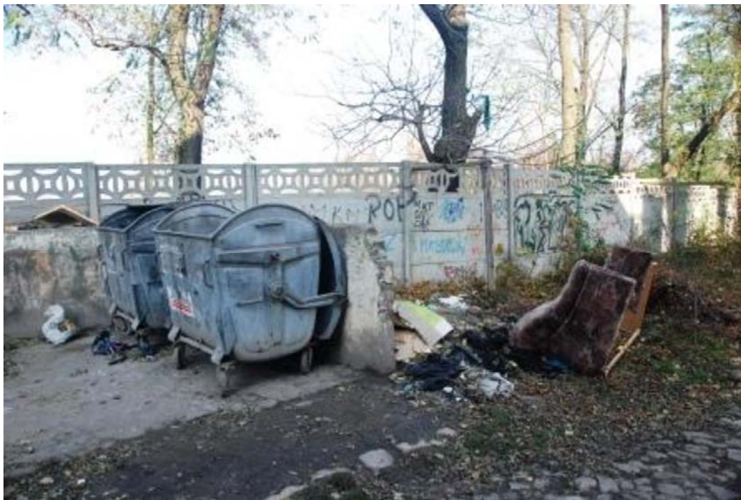
Rycina 5. Koszelew. Miejsce, z którego wykonano fotografię Podskarpia