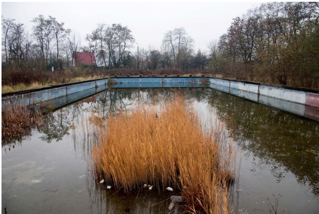
Rycina 10. Pozostałości po obiekcie sportowym Zagłębianka; basen