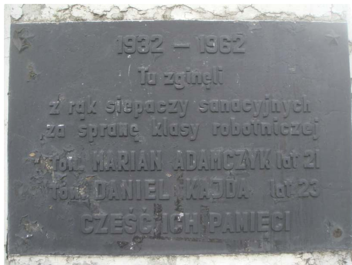
Rycina 16. Treść tablicy pamiątkowej na pomniku stojącym na osiedlu Ksawera