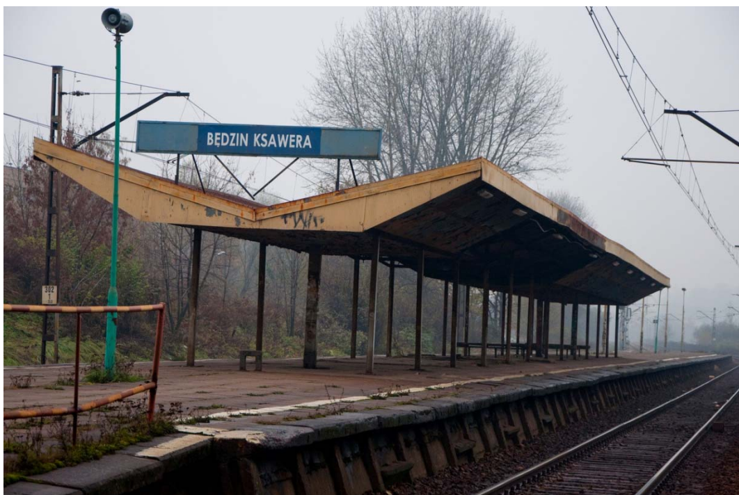
Rycina 13. Stacja Będzin Ksawera