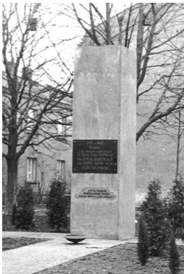
Rycina 17. Pomnik na osiedlu Ksawera; lata sześćdziesiąte XX w.